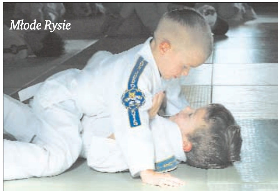
Jak walczyć na macie najmłodszy adept judo na Ursynowie - czyt. str. 10